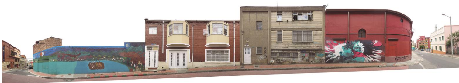
CARRERA 1 BIS