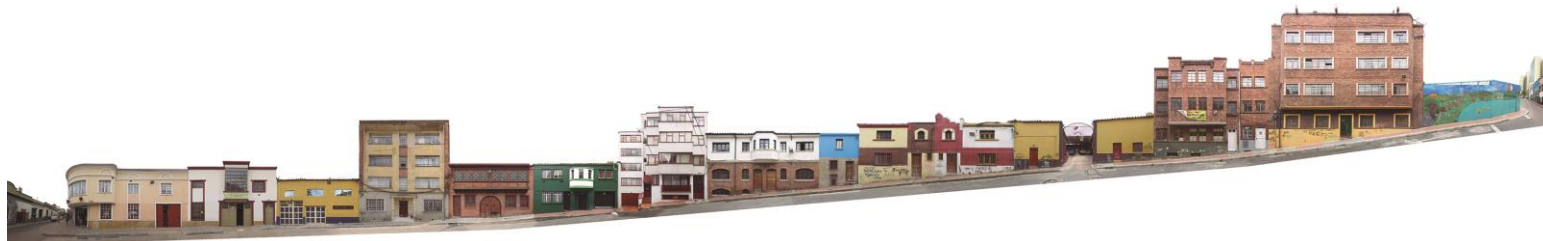
CALLE 12D BIS